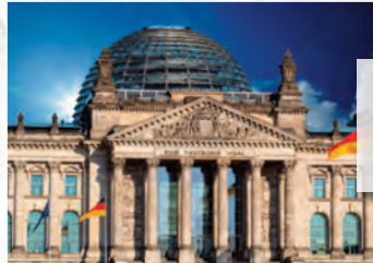
Deutscher Bundestag Berlin

Verbaute Taubenabwehr- systeme: Elektrosysteme